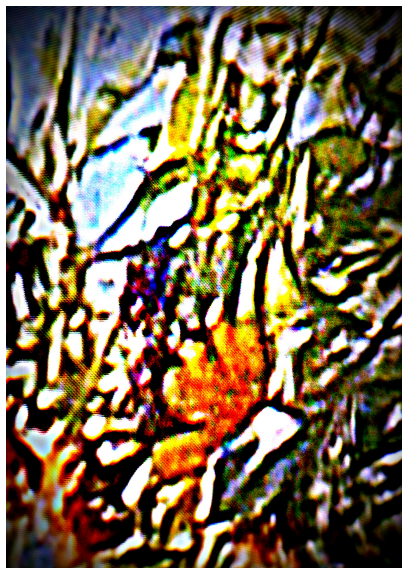
Ilustrație de Vasile MIC