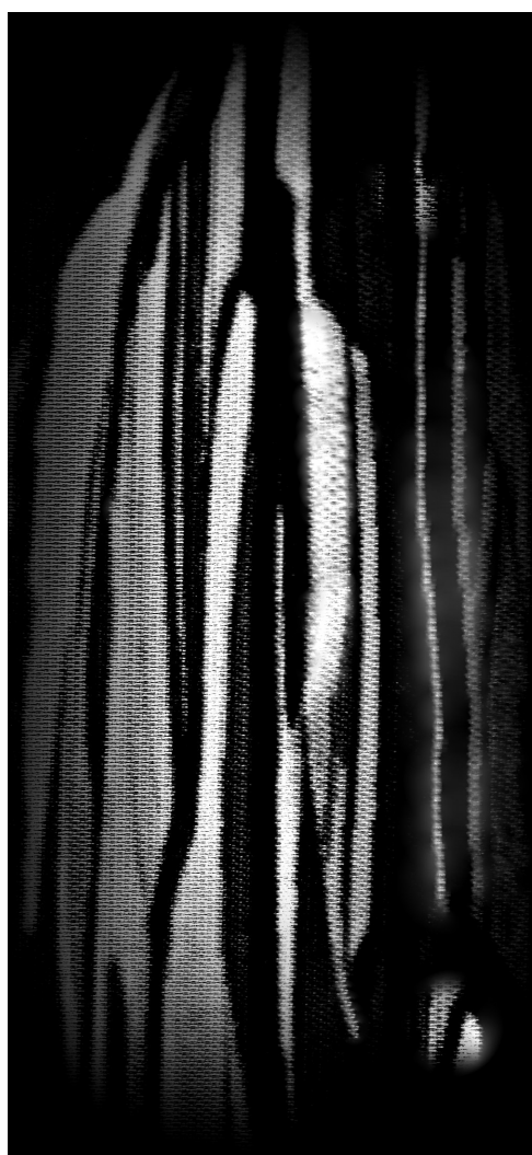
Ilustrație de Vasile MIC

Traducere în limba italiană de Livia Mărcan